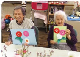
K様・K様「良く考えるわね!」 「素敵に出来たわ!」と、 笑顔を見せて下さいました。