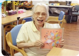
K様、折り紙で作った紅葉の飾り完成!! キラキラビーズがワンポイント!!