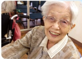
S様、いつも元気で笑顔が素敵!! お話が大好きなS様☆